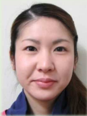
おんり まゆみ 小宮 真由美 おんり まゆみ